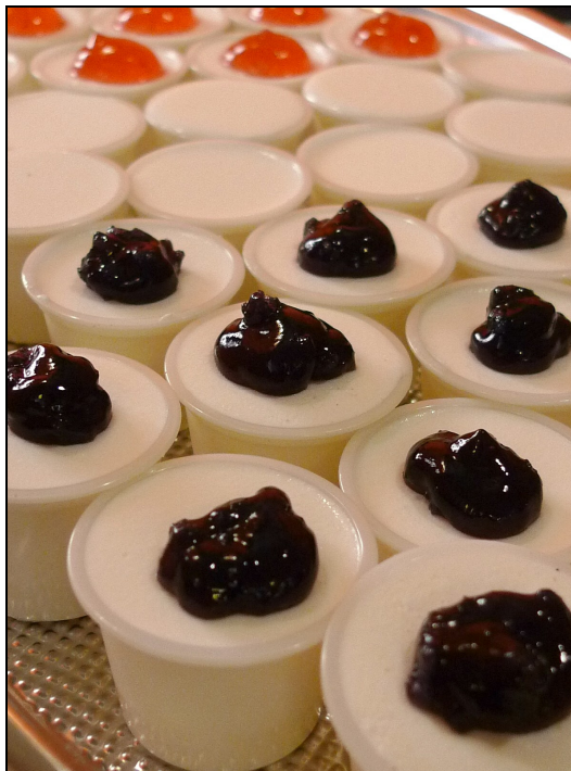
上圖為實品部份圖樣 可依您需求為您訂做製做 連絡電話 (02)2218-2859 / 0982-186-634